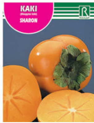
FCPA 0652 Cepellón en malla biodegradable FMDA 1646 Maceta C - 19 (5,5 litros)