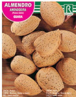
ALMENDRO AMENDEIRA GUARA FCPA 0520 Cepellón en malla biodegradable FMDA 1530 Maceta C - 19 (5,5 litros) FMTA 0040 Maceta C- 25 (10 litros)