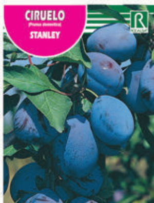
CIRUELO STANLEY FCPA 0595 Cepellón en malla biodegradable FMDA 1610 Maceta C - 19 (5,5 litros) FMTA 0125 Maceta C- 25 (10 litros)