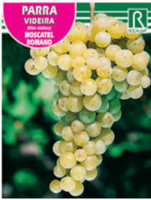
PARRA VIDEIRA (Vitis rotundifolia) MOSCATEL ROMANO