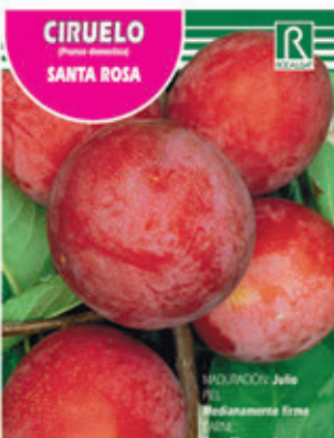
CIRUELO SANTA ROSA FCPA 0580 Cepellón en malla biodegradable FMDA 1590 Maceta C - 19 (5,5 litros) FMTA 0110 Maceta C- 25 (10 litros)