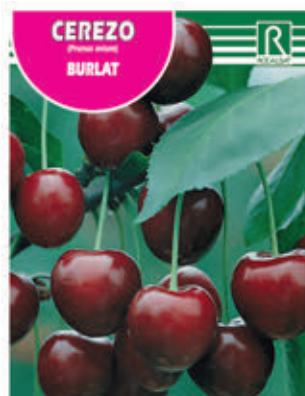
CEREZO BURLAT FCPA 0550 Cepellón en malla biodegradable FMDA 1560 Maceta C - 19 (5,5 litros) FMTA 0080 Maceta C- 25 (10 litros)