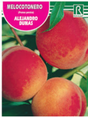
MELOCOTONERO (Prunus persica) ALEJANDRO DUMAS

FCPA 0710 Cepellón en malla biodegradable FMDA 1740 Maceta C-19 (5,5 litros) FMTA 0220 Maceta C-25 (10 litros)