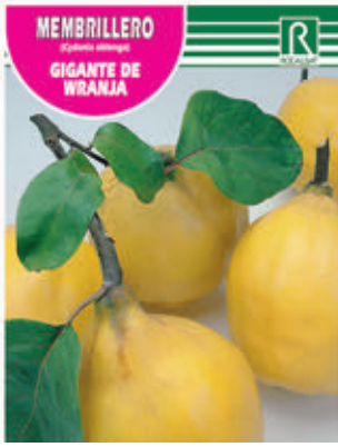
MEMBRILLERO (Eubotrya alberti) GIGANTE DE WRANJA

FCPA 0740 Cepellón en malla biodegradable FMDA 1770 Maceta C-19 (5,5 litros) FMTA 0250 Maceta C-25 (10 litros)