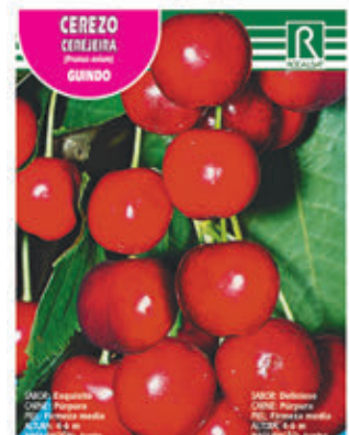
CEREZO CEREJEIRA GUINDO FCPA 0570 Cepellón en malla biodegradable FMDA 1580 Maceta C - 19 (5,5 litros) FMTA 0100 Maceta C- 25 (10 litros)