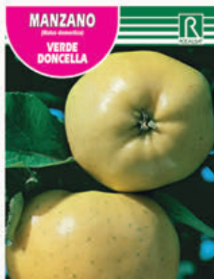
FCPA 0675 Cepellón en malla biodegradable FMDA 1680 Maceta C - 19 (5,5 litros) FMTA 0192 Maceta C-25 (10 litros)