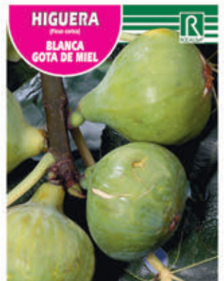
FCPA 0640 Cepellón en malla biodegradable FMDA 1643 Maceta C - 19 (5,5 litros) FMTA 0155 Maceta C-25 (10 litros)