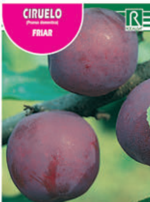
FCPA 0610 Cepellón en malla biodegradable FMDA 1630 Maceta C - 19 (5,5 litros) FMTA 0140 Maceta C-25 (10 litros)