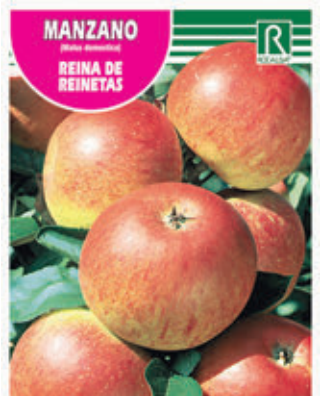
FCPA 0690 Cepellón en malla biodegradable FMDA 1700 Maceta C - 19 (5,5 litros) FMTA 0200 Maceta C-25 (10 litros)