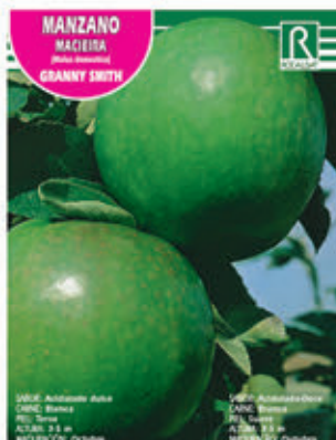
FCPA 0697 Cepellón en malla biodegradable FMDA 1665 Maceta C - 19 (5,5 litros) FMTA 0211 Maceta C-25 (10 litros)