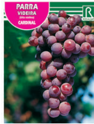
PARRA VIDEIRA (Vitis rotundifolia) CARDINAL