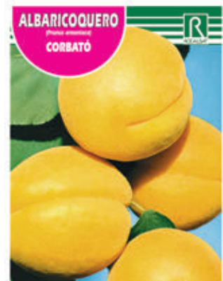
ALBARICOQUERO CORBATÓ FCPA 0505 Cepellón en malla biodegradable FMDA 1510 Maceta C - 19 (5,5 litros) FMTA 0020 Maceta C- 25 (10 litros)