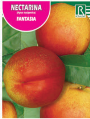
NECTARINA (Prunus nectarina) FANTASIA

FCPA 0760 Cepellón en malla biodegradable FMDA 1777 Maceta C-19 (5,5 litros) FMTA 0270 Maceta C-25 (10 litros)