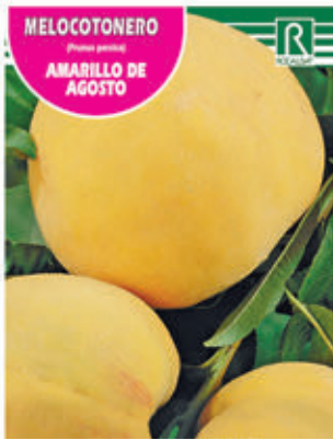
MELOCOTONERO (Prunus persica) AMARILLO DE AGOSTO

FCPA 0710 Cepellón en malla biodegradable FMDA 1740 Maceta C-19 (5,5 litros) FMTA 0220 Maceta C-25 (10 litros)