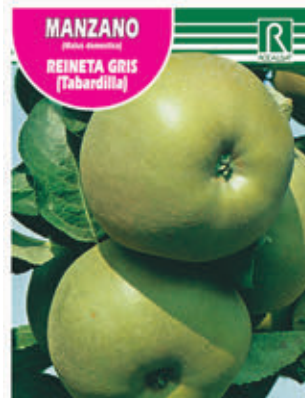
FCPA 0702 Cepellón en malla biodegradable FMDA 1720 Maceta C - 19 (5,5 litros)