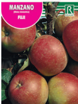
FCPA 0695 Cepellón en malla biodegradable FMDA 1710 Maceta C - 19 (5,5 litros) FMTA 0210 Maceta C-25 (10 litros)