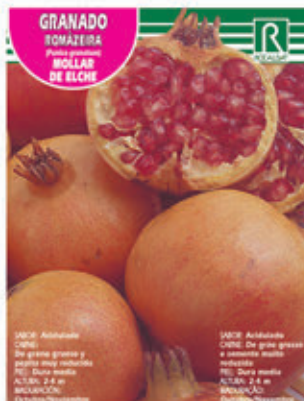
FCPA 0620 Cepellón en malla biodegradable FMDA 1640 Maceta C - 19 (5,5 litros) FMTA 0150 Maceta C-25 (10 litros)