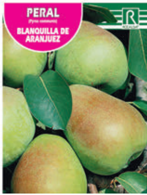
PERAL (Pyrus communis) BLANQUILLA DE ARANJUEZ

FCPA 0810 Cepellón en malla biodegradable FMDA 1810 Maceta C-19 (5,5 litros) FMTA 0340 Maceta C-25 (10 litros)