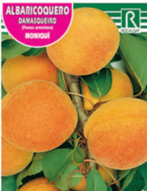
ALBARICOQUERO DAMASQUEIRO MONOUÍ FCPA 0510 Cepellón en malla biodegradable FMDA 1520 Maceta C - 19 (5,5 litros) FMTA 0030 Maceta C- 25 (10 litros)