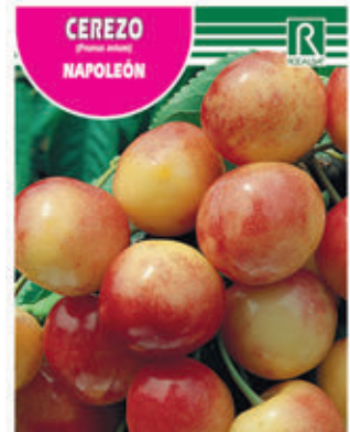
CEREZO NAPOLEÓN FCPA 0530 Cepellón en malla biodegradable FMDA 1540 Maceta C - 19 (5,5 litros) FMTA 0070 Maceta C- 25 (10 litros)