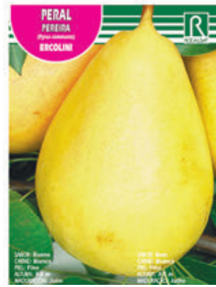
PERAL PEREIRA (Pyrus communis) ERCOLINI

FCPA 0810 Cepellón en malla biodegradable FMDA 1810 Maceta C-19 (5,5 litros) FMTA 0340 Maceta C-25 (10 litros)