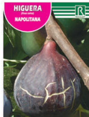
FCPA 0630 Cepellón en malla biodegradable FMDA 1645 Maceta C - 19 (5,5 litros) FMTA 0152 Maceta C-25 (10 litros)