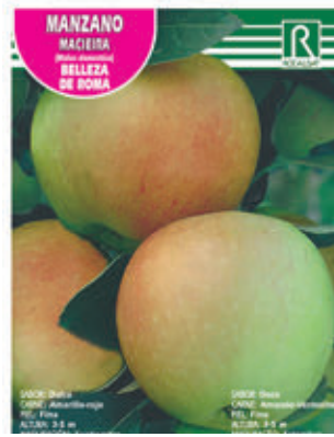
FCPA 0655 Cepellón en malla biodegradable FMDA 1650 Maceta C - 19 (5,5 litros) FMTA 0170 Maceta C-25 (10 litros)