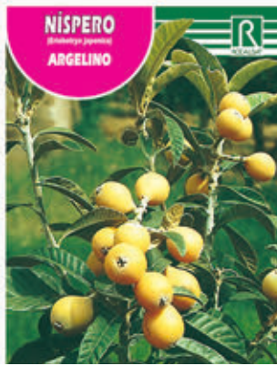
NÍSPERO (Elaeagnus argentea) ARGELINO

FCPA 0780 Cepellón en malla biodegradable FMDA 1790 Maceta C-19 (5,5 litros) FMTA 0290 Maceta C-25 (10 litros)