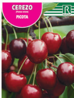
CEREZO PICOTA FCPA 0560 Cepellón en malla biodegradable FMDA 1570 Maceta C - 19 (5,5 litros) FMTA 0090 Maceta C- 25 (10 litros)