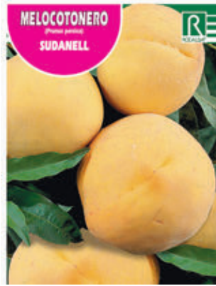
MELOCOTONERO (Prunus persica) SUDANELL

FCPA 0720 Cepellón en malla biodegradable FMDA 1750 Maceta C-19 (5,5 litros) FMTA 0230 Maceta C-25 (10 litros)