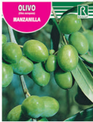
OLIVO (Olea europaea) MANZANILLA

FCPA 0790 Cepellón en malla biodegradable FMDA 1800 Maceta C-19 (5,5 litros) FMTA 0310 Maceta C-25 (10 litros)