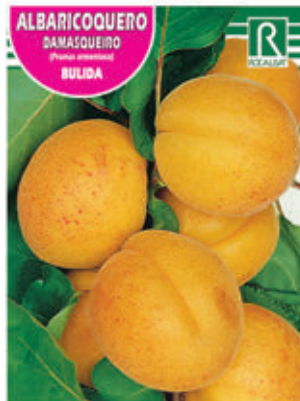
ALBARICOQUERO DAMASQUEIRO BULIDA FCPA 0502 Cepellón en malla biodegradable FMDA 1500 Maceta C - 19 (5,5 litros) FMTA 0010 Maceta C- 25 (10 litros)