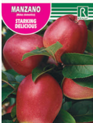
FCPA 0670 Cepellón en malla biodegradable FMDA 1670 Maceta C - 19 (5,5 litros) FMTA 0190 Maceta C-25 (10 litros)