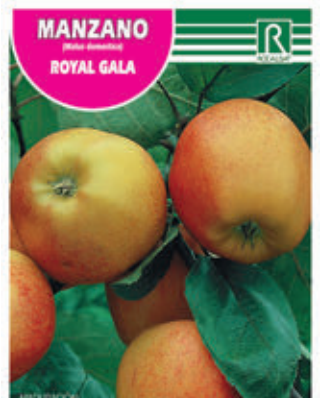
FCPA 0705 Cepellón en malla biodegradable FMDA 1730 Maceta C - 19 (5,5 litros) FMTA 0215 Maceta C-25 (10 litros)