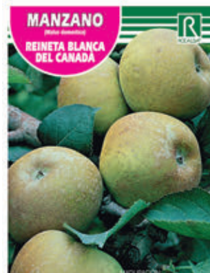
FCPA 0680 Cepellón en malla biodegradable FMDA 1690 Maceta C - 19 (5,5 litros) FMTA 0195 Maceta C-25 (10 litros)