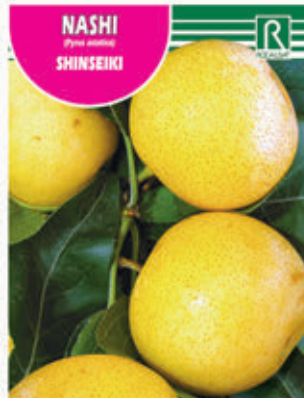
NASHI (Pyrus nankingensis) SHINSEIKI

FCPA 0750 Cepellón en malla biodegradable FMDA 1775 Maceta C-19 (5,5 litros) FMTA 0260 Maceta C-25 (10 litros)