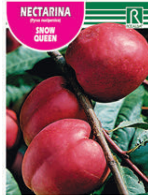
NECTARINA (Prunus nectarina) SNOW QUEEN

FCPA 0770 Cepellón en malla biodegradable FMDA 1780 Maceta C-19 (5,5 litros) FMTA 0280 Maceta C-25 (10 litros)