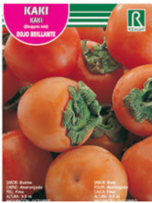
FCPA 0650 Cepellón en malla biodegradable FMDA 1647 Maceta C - 19 (5,5 litros) FMTA 0160 Maceta C-25 (10 litros)