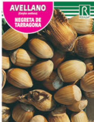
AVELLANO NEGRA DE TARRAGONA FCPA 0525 Cepellón en malla biodegradable FMTA 0050 Maceta C- 25 (10 litros)