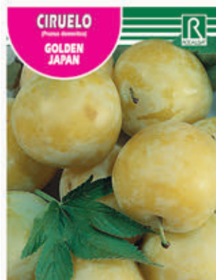
CIRUELO GOLDEN JAPAN FCPA 0590 Cepellón en malla biodegradable FMDA 1600 Maceta C - 19 (5,5 litros) FMTA 0120 Maceta C- 25 (10 litros)