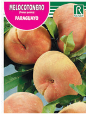
MELOCOTONERO (Prunus persica) PARAGUAYO

FCPA 0730 Cepellón en malla biodegradable FMDA 1760 Maceta C-19 (5,5 litros) FMTA 0240 Maceta C-25 (10 litros)