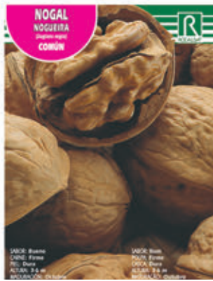
NOGAL (Juglans regia) COMÚN

FMDA 1795 Maceta C-19 (5,5 litros) FMTA 0300 Maceta C-25 (10 litros)