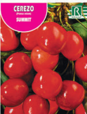
CEREZO SUMMIT FCPA 0540 Cepellón en malla biodegradable FMDA 1550 Maceta C - 19 (5,5 litros) FMTA 0075 Maceta C- 25 (10 litros)