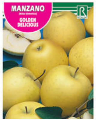
FCPA 0660 Cepellón en malla biodegradable FMDA 1660 Maceta C - 19 (5,5 litros) FMTA 0180 Maceta C-25 (10 litros)