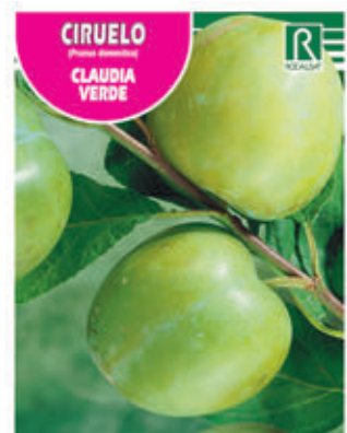
CIRUELO CLAUDIA VERDE FCPA 0600 Cepellón en malla biodegradable FMDA 1620 Maceta C - 19 (5,5 litros) FMTA 0130 Maceta C- 25 (10 litros)